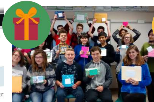
お土産エクステンジ