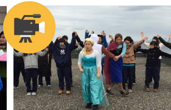
ビデオ制作コンテスト