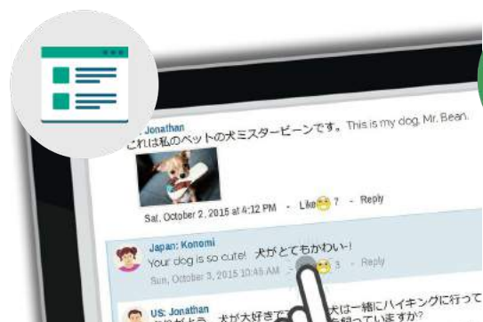
教育用交流ウェブサイト上でのやりとり