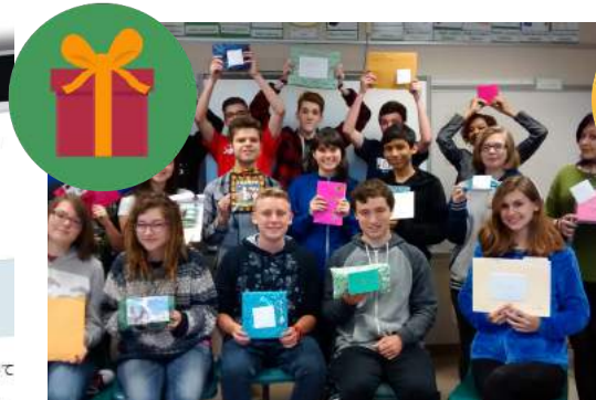
お土産エクステンジ